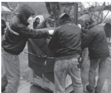
② 運び出される梵鐘