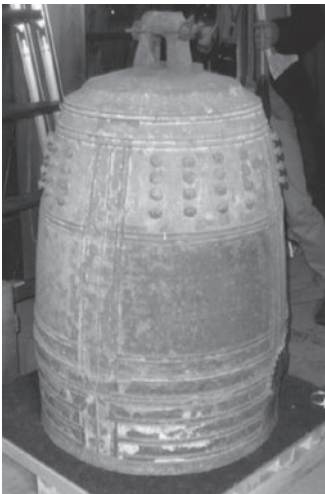
① 取り外された梵鐘

今後、九州国立博物館での展示（四月二十一日～五月三十一日）だけでなく、成分分析等も行われます。新たな発見がありましたら随時報告をさせていただきますので、お楽しみにお待ちしております。