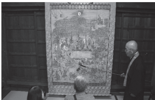
昨年の寺宝展の様子

そのほか、特別演奏会や己書体験、カフェや出店など、様々なイベントをご用意して皆様のお参りをお待ちしていますので、お誘い合わせの上、ぜひ上寺へおいでください。なお、詳細につきましては別紙チラシをご覧ください。