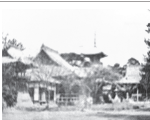
(大正初期の地蔵堂)

しかし、先の大戦で米軍の空襲が激しくなった昭和十九年に餘慶寺各院へ神戸市西須磨国民学校四・五年生の児童が学童集団疎開として来ました。その時このお堂は食堂に改造されました。