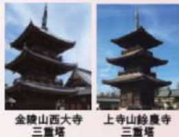
金陵山西大寺 三重塔 上寺山餘慶寺 三重塔