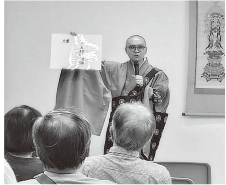
▲仏教法話の様子『生まれる事はHappy birthdayと言えるのか』

秋のほどよい暖かさに包まれた十月十四日、今年で第二十二回の餘慶寺寺宝展が開催されました。 薬師如来坐像をはじめとする多くの寺宝が公開されご加護にあずかろうと多くの参拝客が訪れました。